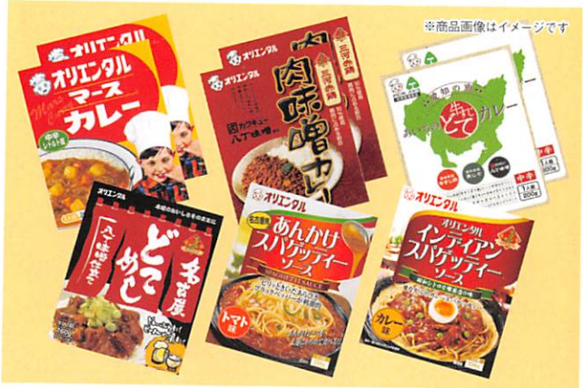
※商品画像はイメージです

昭和20年に創業し、本格的な家庭用カレーを世に送り出した「オリエンタル」。昔ながらの懐かしいカレーや、創作性に富んだご当地カレー、あんかけスパゲッティソースなど、ご家庭で楽しめるセットです。