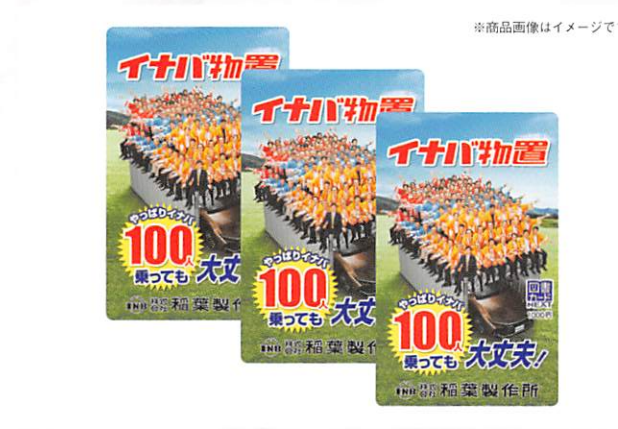
※商品画像はイメージです