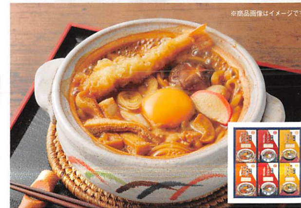
※商品画像はイメージです

もちもちした食感の半生麺と、愛知県産たまり醤油や名古屋コーチン鶏ラエキス入りのカレースープでいただく、名古屋の麺の詰め合わせです。