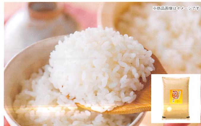
※商品画像はイメージです

愛知県を代表する品種で、大きな粒が特徴のお米です。食感、粘りがあり、あっさりとした口当たりでくせが少なく、存在感があって食べごたえがあります。