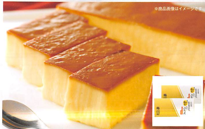
※商品画像はイメージです

名古屋コーチンの卵を100%使用した強い弾力のある生地と、ほろ苦いカラメルとの相性は絶妙です。