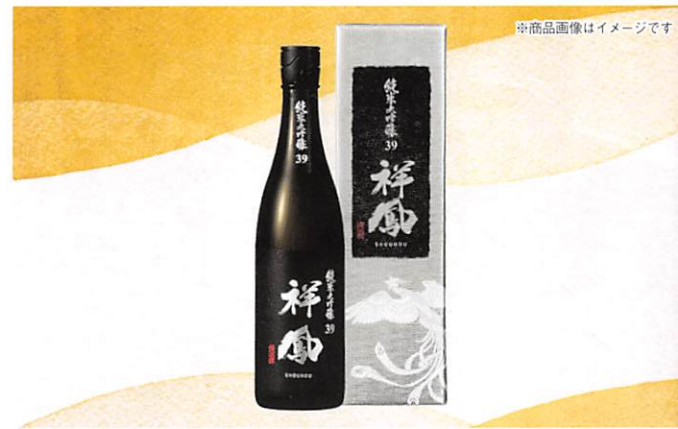
※商品画像はイメージです

1853年創業の清洲にある酒蔵の純米大吟醸酒です。兵庫県産山田錦を100%使用し39%まで高精米して醸しており、豊かなコクと深みのある味わいが特徴です。※申込専用はがきの年齢欄を忘れずにご記入ください。