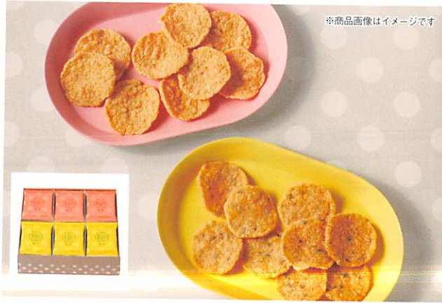
※商品画像はイメージです

海の恵みの風味とコクを大切に、からりと揚げて後味はあっさり。ひとくちサイズの小粋な揚げ煎です。