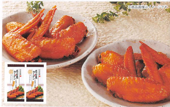
※商品画像はイメージです

日本三大地鶏のひとつ「名古屋コーチン」を使用した煮手羽です。昆布専門店ならではの「出汁」を使用し、じっくり炊き上げました。名古屋コーチンは弾力があり濃厚な味が特徴です。