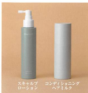
スカルプローション コンディショニングヘアミルク