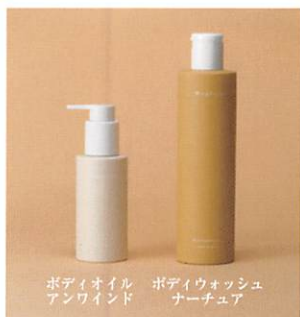
ボディオイル アンwind ボディウォッシュ ナーチャア