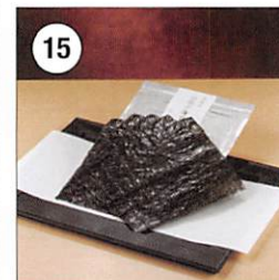
15 初摘み海苔 焼のり全型詰合せ 有明海産焼海苔 5枚入×7 愛知県産焼海苔 5枚入×4