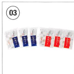
03 老舗鯉節屋の 和風だしセット 6袋