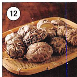
12 大分産椎茸どんこ 130g