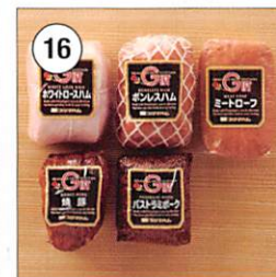
16 <プリマハム> 岩手ハムギフト ホワイトロースハム、ボンレスハム、 焼豚、ミートローフ・パストラミ ポーク 計1.6kg 賞味期限: 製造日より冷蔵60日