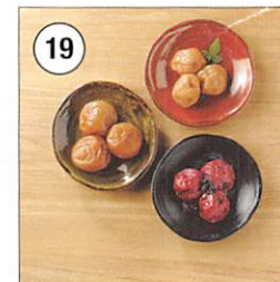
19 <和歌山・紀州高田果園> 紀州南高梅3種セット はちみつ入梅干・まるやか梅・ うす塩味しそ漬梅干(梅800g、 しそ葉100g) 各900g