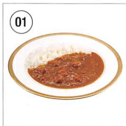
01 ビーフカレー 中辛 200g×2食