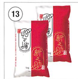
13 新潟県産新之助 5kg×2袋