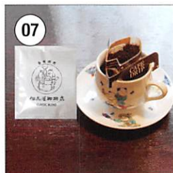
07 <但馬屋珈琲店> ドリップバッグコーヒー 【クラシックブレンド】 12g×8個