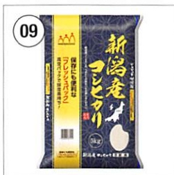
09 フレッシュパック 新潟県産コシヒカリ 5kg