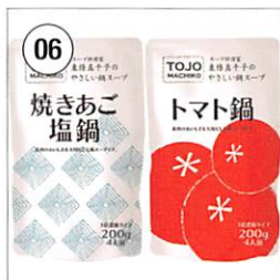
06 東條真千子の やさしい鍋スープセット 焼きあご塩鍋・トマト鍋(3倍濃 縮タイプ) 各200g×1袋