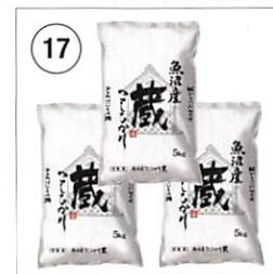
17 魚沼産コシヒカリ 5kg×3袋