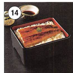
14 鹿児島県産 関西風焼鰻蒲焼 100g×3尾 賞味期限: 製造日より冷凍90日