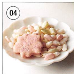
04 <鞍馬庵> 京干菓華子 京花かんざし・京花あられ 各1袋