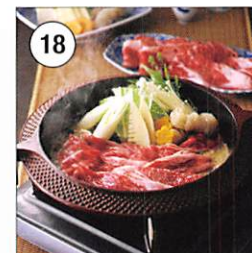
18 近江牛 肩ロース すき焼き用 600g 賞味期限: 出荷日より冷凍25日