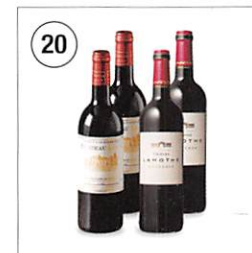
20 [ワイン] ボルドー 赤ワインセット 750ml×4本