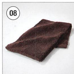
08 <Cotton TRES> フェイスタオル 34×80cm ブラウン 2枚セット