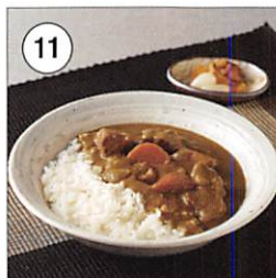
11 鹿児島 黒豚カレージャンボ 250g×5食