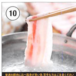
10 イベリコ豚 バラ肉 鍋・しゃぶしゃぶ用 スライス 500g×2P