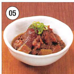
05 <千房> 国産牛すじこんにゃく 115g×2袋