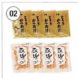
02 <高福> とろろかつお汁・ かつお枯節 各4袋