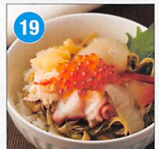
19 7種海鮮 松前漬 帆立、ヒラメ、ホッキ貝、 ズワイガニむき身、タコ、味付 数の子、いくら醤油漬、 松前漬 300g×4