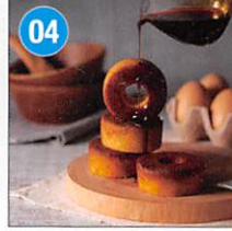
04 <森の庭> 焦がしキャラメルが しみ込んだバーム 5個 賞味期限: 製造日より常温90日