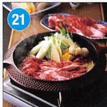
21 近江牛 肩ロース すき焼き用 800g 賞味期限: 出荷日より冷凍30日