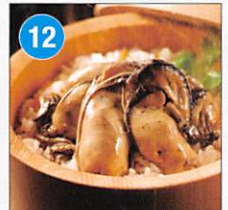
12 <日高見市場> 牡蠣の潮煮 100g×3個×2箱 賞味期限: 出荷日より冷蔵40日