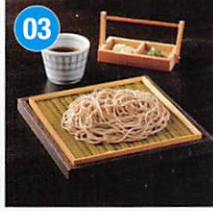
03 信州蕎麦詰合せ 200g×3箱