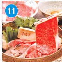
11 近江牛 モモ、バラ すき焼き用 約300g 賞味期限: 製造日より冷凍30日