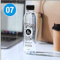
07 <AMPERSAND> ミネラルウォーター 330ml×24本 原産地: 大分県由布市