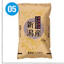
05 <越後ファーム> 新潟県産こしひかり 4.5kg