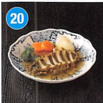
20 <日本のおいしいお料理> 日本料理店の 天然あわびバター蒸し 180g×2個 賞味期限: 出荷日より冷凍90日