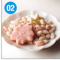
02 <鞍馬庵> 京干菓華子 京花かんざし 京花あられ×各1袋