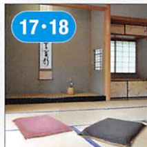
17-18 新潟成型(当社子会社)の商品 <finplastcushion> 3Dクッション ベーシック(ブラック) ちぢみカバー付き 45×45cm ピンク 17 ブルー 18