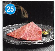
25 <スギモト> 松阪牛 肩ロース すき焼き・しゃぶしゃぶ用 各725g 賞味期限: 出荷日より冷凍30日