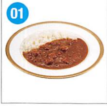
01 ビーフカレー 中辛 200g×2食