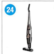
24 <エレクトロラックス> Pure Q9 マホガニーブロンズ PQ92-3EMF