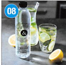
08 <AMPERSAND> ミネラルウォーター 600ml×24本 原産地: 大分県由布市