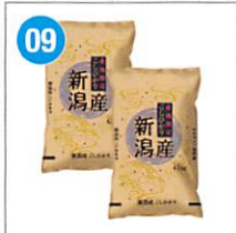
09 <越後ファーム> 新潟県産こしひかり 4.5kg×2袋