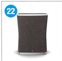
22 <Stadler Form> 空気清浄機 Roger 2.0 little ブラック サイズ: 約33×17×45cm 適応床面積: 約19畳