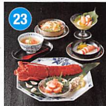
23 <日本のおいしいお料理> 伊勢海老 和洋割烹料理 5種 賞味期限: 出荷日より冷凍90日