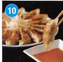
10 特選はままつ餃子 60個 賞味期限: 出荷日より冷凍30日