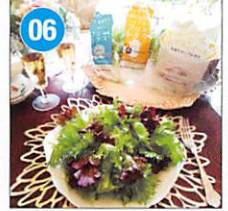
06 <AML健康野菜> レタス3種セット 高カルシウム フリルレタス 4袋 フリル&レッドリーフ レタスMix 2袋 低カリウム フリルレタス 1袋 賞味期限: 出荷日より冷蔵14日