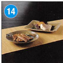
14 鹿児島島の美味 詰合せ 3種12袋 賞味期限: 出荷日から冷凍30日