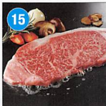
15 宮崎牛 サーロイン ステーキ用 340g 賞味期限: 出荷日より冷凍90日