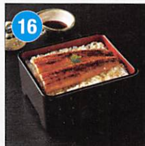
16 鹿児島県産 関西風焼鰻蒲焼 100g×3尾 賞味期限: 製造日より冷凍90日