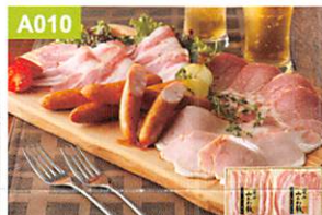
A010 スギモト みかわ豚ハムバラエティー

愛知県のブランド豚「愛知みかわ豚」は臭みがなくもちもちとした食感から「もち豚」と称されておまの旨味を引き立たせます。素材の持つ美味しさをお楽しみいただけるようシンプルなお味付けで仕上げております。