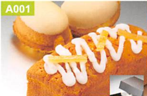
A001 パテスリー・シュ・コーベ アソートシロン

爽やかな酸味の効いた上質なレモンをふんだんに使用して仕上げたバウンドケーキと、ノスタルジックな味わいの檸檬ケーキの詰合せです。