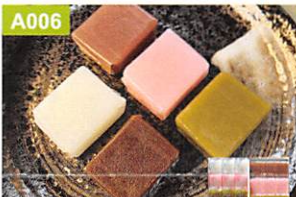
A006 青柳総本家 ひとくちセット

●車えび姿焼き、車えびあられ焼き×各1、甘えび磯焼き×2、甘えび炙り焼き、赤えび炙り焼き、ぼたんえび炙り焼き×各3