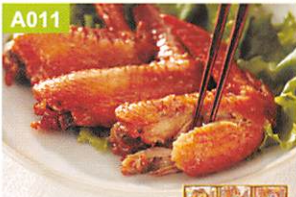
A011 石昆 うみあーっ手羽詰合せ

●ロースハム・ベーコン各50g×各1、厚切りモモハム80g×1、あらびきウィンナー・あらびきチロリソー各130g×各1