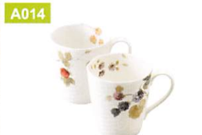
A014 NARUMI ルーシーガーデン ペアマグ

●手折きしめん・手折うどん各90g×各2、うどん220g×4、めんつゆ25g×3