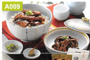
A009 うなぎ割烹「一横」 うなぎ丼セット

さきみ鱧と鱧の肝煮の「うなぎ」セットです。香りやコクのある「一横特製」の蒲焼のたれは鱧本来の旨味を引き立たせます。うなぎ割烹「一横」の自慢の味を是非ご家庭でご賞味ください。