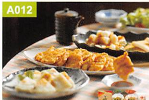
A012 ヤマサちくわ ヤマサちくわ詰合せ

文政10年創業の老舗「豊橋名産ヤマサちくわ」の代表的商品を集めた詰合せです。そのまま生でお好みでわび醤油を付けてお召し上がりください。