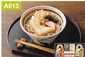
A013 なごやしめん亭 ふるさと麺詰合せ

●特製ちくわ2本入・豆ちくわ・生姜豆・上揚半・野菜ソフト・青じそ揚・タコそふと×各1