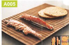
A005 桂新堂 海老づくし

●野菜生活100国産プレミアム白桃ミックス・メロンミックス・さくらんぼミックス・ラ・フランスミックス×各125ml×各3、巨峰ミックス・デコポンミックス各125ml×各2