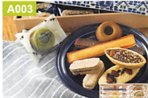
A003 名古屋ふらんす ル・キャドール 18個入

名古屋ふらんす直営店オリジナルの焼き菓子を詰め合わせたバラエティ豊かなギフトセットです。