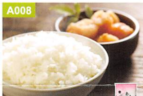
A008 愛知県産 あいちのかおり5kg・ ミネアサヒ2kg

●マースカレーレトルト版200g×4、マースカレー小130g×2、マースカレーレトルト版辛口200g×2、即席ハヤシドビー・即席カレー各95g×各1、オリエンタルオリジナルスプーン×1、マースハヤシルウレトルト版200g×2