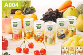
A004 カゴメ 野菜生活100 国産プレミアムセット

●アーモンドの樹(ショコラ、プレーン×各1、ピスタチオ×2)、ガトー・ロン(カフェモカ、抹茶、レモン×各1)、タルト・アムール(ショコラ、フロマージュ、フレーズ×各1)、ダコンテ(ピスタチオ、ショコラ、レモン、プラリネ×各2)