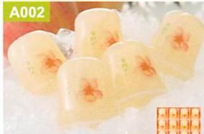
A002 桃花亭 プチ完熟白桃ゼリー 20個入

地元愛知県産の完熟した桃を丁寧に湯むきし、果実の繊維を残す製法で完熟白桃の美味しさを追求しました。