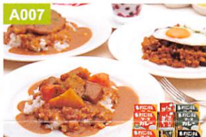
A007 オリエンタル カレーグルメセット

●四季づくし(しろ、上がり、抹茶×各3、さくら×6)、ひとくち(しろ、くろ、上がり、抹茶、さくら×各3)