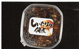
夢食研(株) しいたけの佃煮