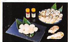
三陸産 旨味たっぷり ホタテとカキのセット・・・P4