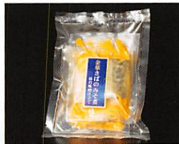
(有)マルキチ阿部商店 金華さばのみそ煮 ～仙台味噌仕立て～ 賞味期限 製造日から180日