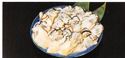
(株)ハイブリッドラボ 三陸産 冷凍カキ 800g