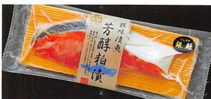
(株) 高德海産 三陸銀鮭 芳醇粕漬