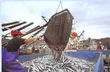
女川港 秋刀魚の水揚げ