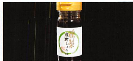
(有)金華山醸造 燻製昆布しょうゆ