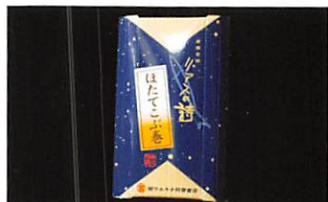
(有)マルキチ阿部商店 リアスの詩 ほうたこ巻