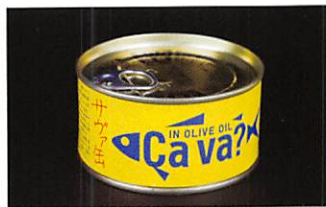
岩手缶詰(株) 国産サバのオリーブオイル漬け