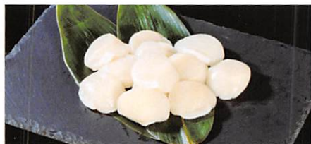
(株)ハイブリッドラボ 三陸産 冷凍ホタテ貝柱 250g