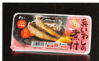
(株)鮮冷 国産真いわしの煮付