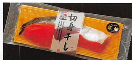
(株) 高德海産 三陸銀鮭 切身干し