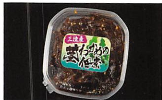
夢食研(株) 菜わかめの佃煮