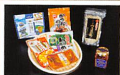
また食べたい! 気仙沼の逸品セット・・・P9