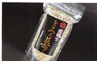
(株)一番 荒削りとろろ昆布 賞味期限 製造日から1年