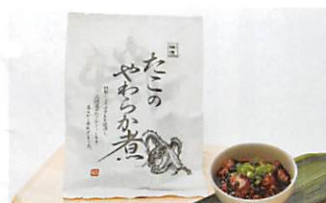
(株)鮮冷 たこのやわらか煮