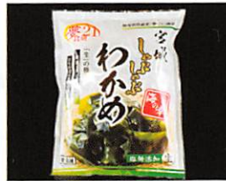
夢食研(株) しゃぶしゃぶわかめ 賞味期限 製造日から180日