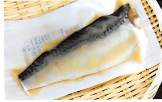
山徳平塚水産(株) 金華さば西京味噌漬 賞味期限 製造日から 60日