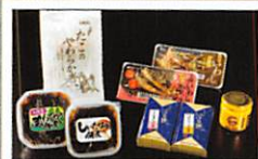
女川謹製!浜の母ちゃん おもてなしセット・・・・・・P5