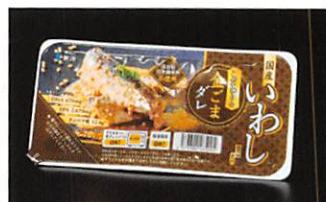
(株)鮮冷 国産いわし煮付 こだわりの金ごまダレ