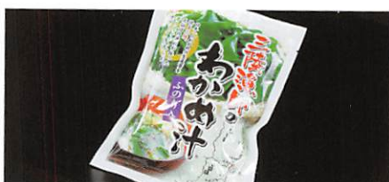
(株)マルニシ 三陸漁師のわかめ汁 ふりのり入り 賞味期限 製造日から180日