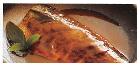
(株) タカタク 金華さば味噌煮