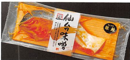
(株) 高德海産 三陸銀鮭 仙台味噌