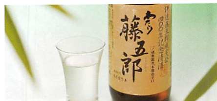
(株)一ノ蔵 清酒 わたり藤五郎