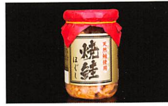
双日食料水産(株) 焼鯖ほぐし