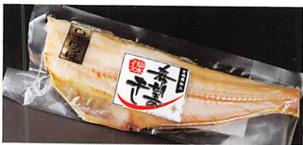
(株)仙水フーズ 希望の干し シマホッケ半身干し×2