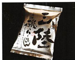
釜石振興開発(株) 釜石三陸磯らーめん(塩)