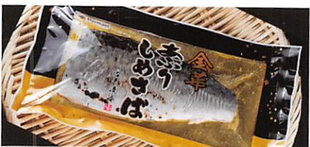
(株)阿部長商店 あぶりしめさば