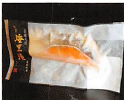
(株)御前屋 海里漬 銀鮭粕漬 賞味期限 製造日から90日