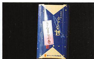
(有)マルキチ阿部商店 リアスの詩さんまこぶ巻