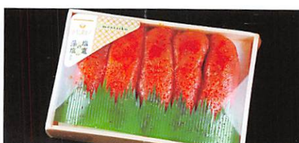
マルミヤフーズ(株) 塩窟の藻塩仕込み辛子明太子