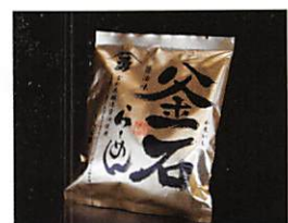
釜石振興開発(株) 釜石らーめん(醤油)