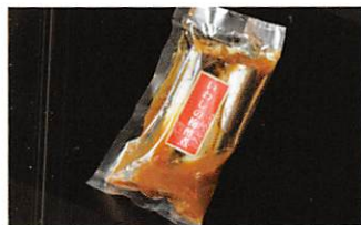
(有)マルキチ阿部商店 いわしの梅酢煮 賞味期限 製造日から180日