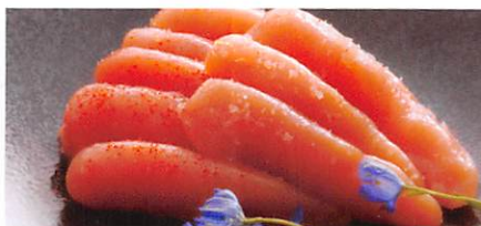
(株) 湊水産 優しい辛さの無着色明太子