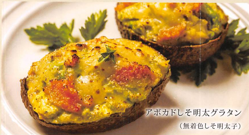
アボカドしそ明太グラタン (無着色しそ明太子)