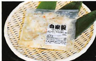
(株)御前屋 浜のてっちゃん 牛シマチョウ味付け 塩味 賞味期限 製造日から90日