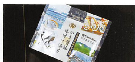
(株)横田屋本店 かき醤油味付け海苔 賞味期限 製造日から180日