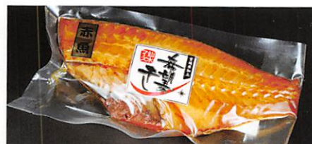
(株)仙水フーズ 希望の干し 赤魚醤油干し