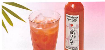
田所食品(株) ストロベリーピュア100しぼりたて