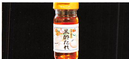
(有)金華山醸造 黒酢たれ