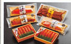
選ばれし石巻 うまいもの祭りセット・・・P7