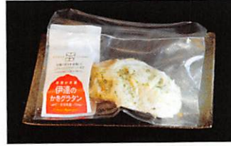
本田水産(株) 伊達のかきグラタン 賞味期限 製造日から 90日