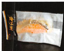
(株)御前屋 海里漬 銀鮭塩麹漬 賞味期限 製造日から90日