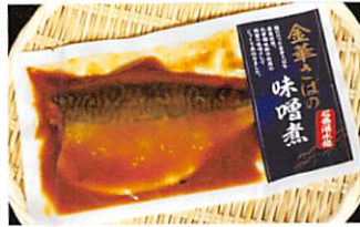
山徳平塚水産(株) 金華さば味噌煮 賞味期限 製造日から 1年