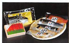
仙台市場、厳選 詰め合わせセット・・・P11