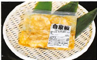
(株)御前屋 浜のてっちゃん 牛シマチョウ味付け しょうゆ味 賞味期限 製造日から90日