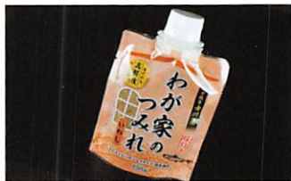
(株)鮮冷 わが家のつみれいわし×2 賞味期限 製造日から1年