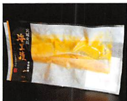
(株)御前屋 海里漬 銀鮭西京漬 賞味期限 製造日から90日