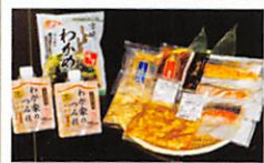
女川いっぱいおなかはいっぱい! あったかごはんセット・・・・P6