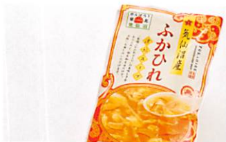
(有)リアスの国から 気仙沼産ふかひれ濃縮スープ 賞味期限 製造日から1年