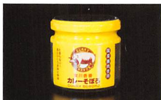
(有)マルキチ阿部商店 カレーそぼろ