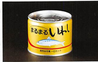
岩手缶詰(株) まるまるいわし昆布味噌煮