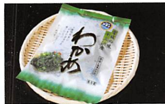
(有)マルイチ西條水産 塩蔵わかめ 賞味期限 製造日から 90日