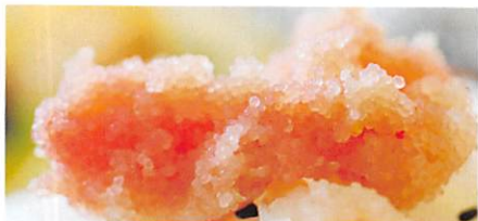
(株) 湊水産 塩分控えめ無着色たらこ