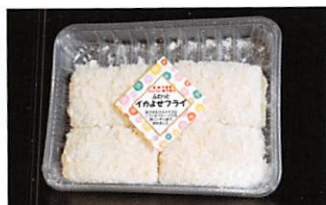
(株)カクト鈴木商店 ふわっとイカよせフライ 賞味期限 製造日から 90日