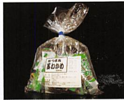
(有)リアス海藻店 おつまみ 茎わかめ