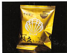
(株)小山製麺 中村家監修 帆立らーめん