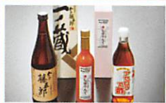
亶理山元、復興への 挑戦ギフト・・・・・・P10