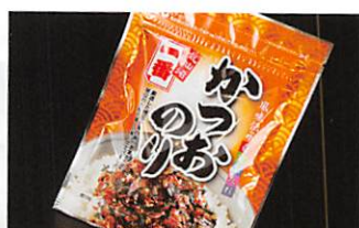
(株)一番 かつおのり 賞味期限 製造日から1年