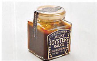
(株)石渡商店 気仙沼完熟牡蠣のオイスターソース 賞味期限 製造日から1年