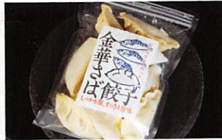
(株)布施商店 金華さば餃子 賞味期限 製造日から 1年