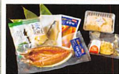
石巻からあったけー うまいものセット・・・・・・P8