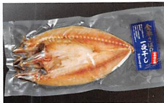
山徳平塚水産(株) 金華さばの一夜干し 賞味期限 製造日から 60日