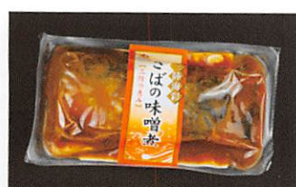
(株)阿部長商店 三陸海彩 さばの味噌煮 賞味期限 製造日から1年