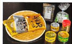
釜石厳選! お手軽グルメセット・・・P12