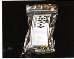
(有)リアス海藻店 和風わかめスープ