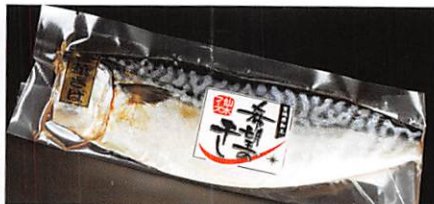
(株)仙水フーズ 希望の干し 金華さば文化干し×2