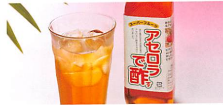
亘理アセロラ園 アセロラで酢