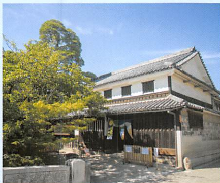
▲ 語らい座 大原本邸 正面