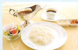
▲ホテル伝統のビーフカレー