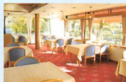
▲レストラン ウイステリア