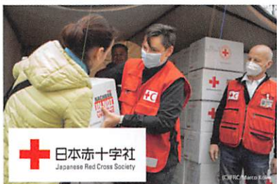
ウクライナで活動する赤十字スタッフ