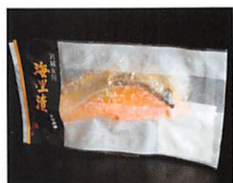
(株)御前屋 海里漬 銀鮭塩麴漬 賞味期限 製造日から90日