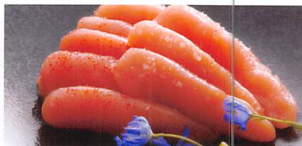
湊水産(株) 優しい辛さの無着色明太子