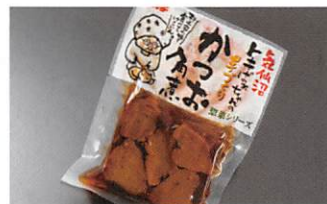
マルチ村上商店 トキばあちゃんの手づくりかつお角煮 賞味期限 製造日から90日