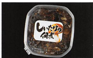
夢食研(株) しいたけの佃煮