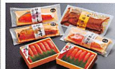
石巻市 Ishinomaki City