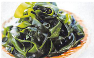
(有)マルイチ西條水産 塩蔵わかめ 賞味期限 製造日から 90日