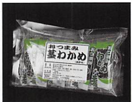
(有)リアス海藻店 おつまみ茎わかめ 賞味期限 製造日から 180日