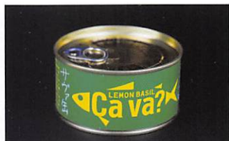
岩手缶詰(株) 国産サバのレモンバジル味 賞味期限 製造日から 3年