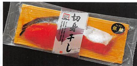
(株)高徳海産 三陸銀鮭 切身干し