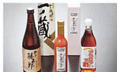
亶理・山元町 Watari・Yamamoto Town