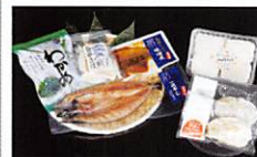
石巻市 Ishinomaki City