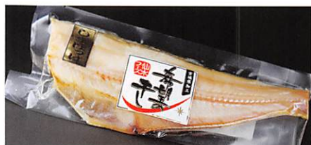
(株)仙水フーズ 希望の干し シマホッケ半身干し×2