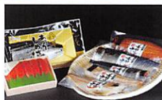
仙台市 Sendai City