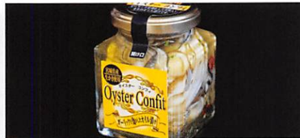
(株)丸ほ保原商店 オイスターコンフィ(かきのオイル漬け)