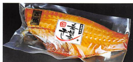
(株)仙水フーズ 希望の干し 赤魚醤油干し