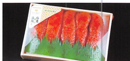
マルミヤフーズ(株) 塩窟の藻塩仕込み辛子明太子