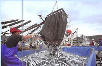
女川港 秋刀魚の水揚げ