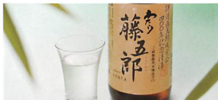
(株)一ノ蔵 清酒 わたり藤五郎