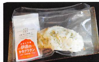
本田水産(株) 伊達のかきグラタン×2 賞味期限 製造日から 90日