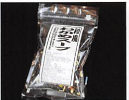
(有)リアス海藻店 和風わかめスープ 賞味期限 製造日から 180日