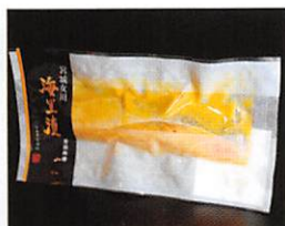
(株)御前屋 海里漬 銀鮭西京漬 賞味期限 製造日から90日