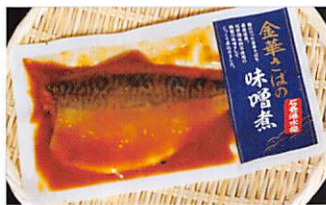
山徳平塚水産(株) 金華さば味噌煮 賞味期限 製造日から 1年