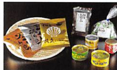
釜石市 Kamaishi City

北は釜石、南は亶理・山元まで東北の「おいしい」を ラックランドを通じてお届けします。