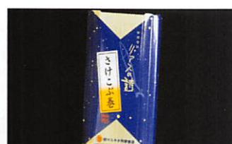
(有)マルキチ阿部商店 リアスの詩 さげこぼ巻