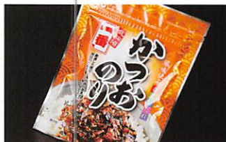
(株)一番 かつおのり 賞味期限 製造日から1年