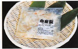
(株)御前屋 浜のてっちゃん 牛シマチョウ味付け 塩味 賞味期限 製造日から90日