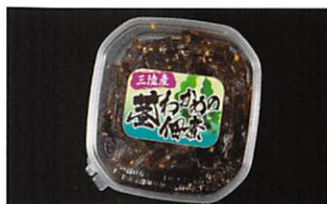
夢食研(株) 茎わかめの佃煮