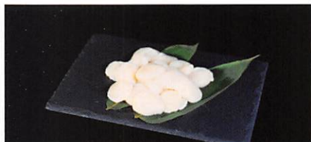
(株)ハイブリッドラボ 宮城県産 冷凍ホタテ貝柱 250g