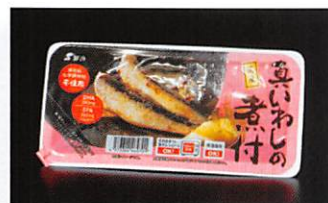
(株)鮮冷 国産真いわしの煮付