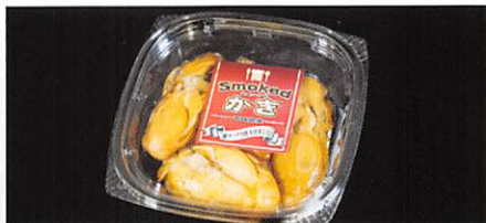
(株)丸ほ保原商店 かき燻製