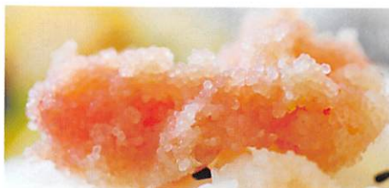
湊水産(株) 塩分控えめ無着色たらこ