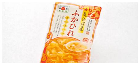
(有)リアスの国から 気仙沼産ふかひれ濃縮スープ 賞味期限 製造日から1年