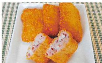
(株)カクト鈴木商店 ふわっとイカよせフライ 賞味期限 製造日から 90日