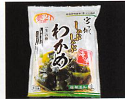
夢食研(株) しゃぶしゃぶわかめ 賞味期限 製造日から180日