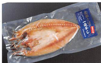
山徳平塚水産(株) 金華さばの一夜干し 賞味期限 製造日から 60日