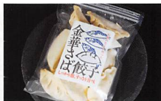
(株)布施商店 金華さば餃子 賞味期限 製造日から 1年