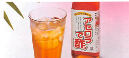
亘理アセロラ園 アセロラで酢