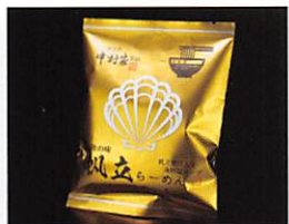
(株)小山製麺 中村家監修 帆立らーめん 賞味期限 製造日から 180日