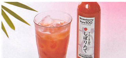
田所食品(株) ストロベリーピュア100しぼりたて