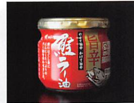
双日食料水産(株) 鮭ラー油 賞味期限 製造日から 1年半