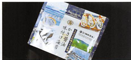
(株)横田屋本店 かき醤油味付け海苔 賞味期限 製造日から180日