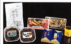
女川町 Onagawa Town