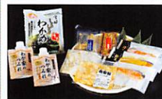
女川町 Onagawa Town