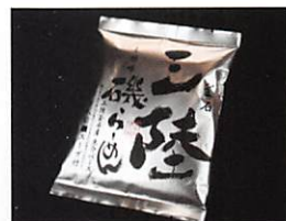
釜石振興開発(株) 釜石三陸産らーめん(塩) 賞味期限 製造日から 180日