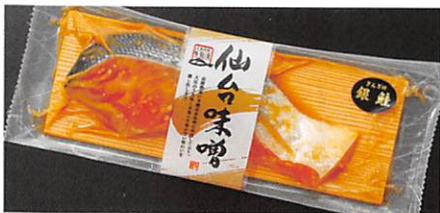
(株)高徳海産 三陸銀鮭 仙台味噌