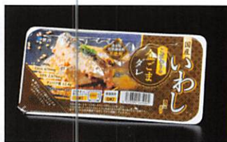
(株)鮮冷 国産いわし煮付 こだわりの金ごまダレ