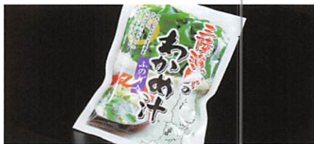
(株)マルニシ 三陸漁師のわかめ汁 ふのり入り 賞味期限 製造日から180日