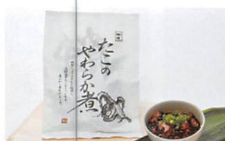
(株)鮮冷 たこのやわらか煮