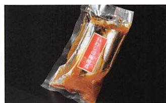
(有)マルキチ阿部商店 いわしの梅酢煮 賞味期限 製造日から180日