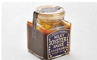
(株)石渡商店 気仙沼完全牡蠣のオイスターソース 賞味期限 製造日から1年