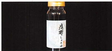
(有)金華山醸造 燻製昆布しょうゆ