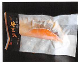
(株)御前屋 海里漬 銀鮭粕漬 賞味期限 製造日から90日