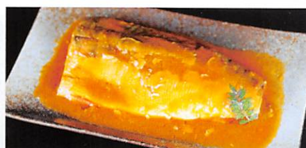
(株)タカトク 金華さば味噌煮