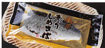
(株)阿部長商店 あぶりしめさば