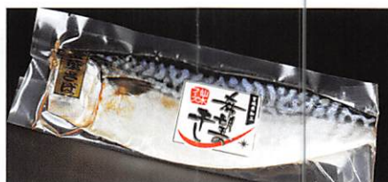
(株)仙水フーズ 希望の干し 金華さば文化干し×2