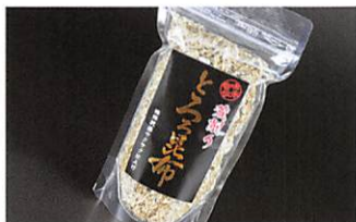
(株)一番 荒削りとろろ昆布 賞味期限 製造日から1年