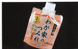
(株)鮮冷 わが家のつみれいわし×2 賞味期限 製造日から1年