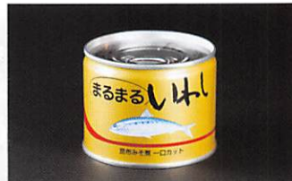
岩手缶詰(株) まるまるいわし昆布味噌煮 賞味期限 製造日から 3年