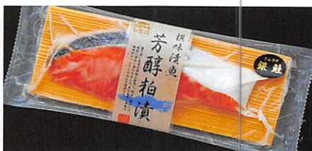
(株)高徳海産 三陸銀鮭 芳醇粕漬