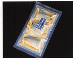
(有)マルキチ阿部商店 金華さばのみそ煮 ～仙台味噌仕立て～ 賞味期限 製造日から180日