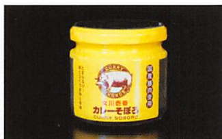
(有)マルキチ阿部商店 カレーそぼろ