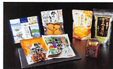
気仙沼市 Kesenuma City