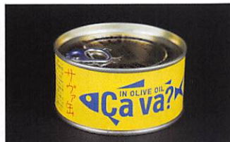
岩手缶詰(株) 国産サバのオリーブオイル漬け 賞味期限 製造日から 3年