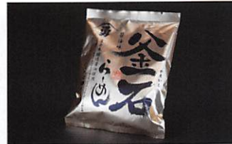
釜石振興開発(株) 釜石らーめん(醤油) 賞味期限 製造日から 180日