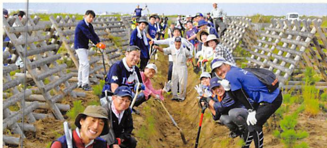
東日本大震災復興支援「海岸林再生プロジェクト」の作業に全国からのボランティアが集う(宮城県)