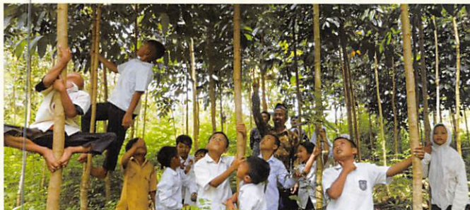
子ども達が植え、大事に育てた苗木が木陰をつくる森となる(インドネシア)

アジア、太平洋地域を中心に国内外で22,000ヘクタールの 緑化活動を続けています。植えて終わりではなく、苗木を 大きく育て、維持していくための人を育てること。そして、環 境保全への住民の意識も変えること。オイスカが60年間 大切にしている考え方は、これまでも、そしてこれからも。