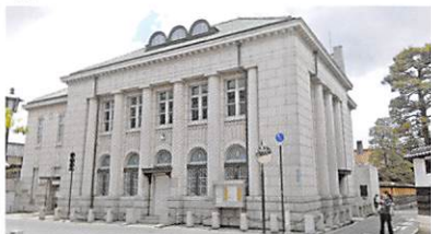
新展示施設外観イメージ

大原美術館は、日本初の西洋美術中心の私立美術館として1930年倉敷の地に誕生。オリエントの古美術作品と、美術館コレクションの礎を築いた画家・児島虎次郎が描いた作品を展示するための新施設の開館を目指します。